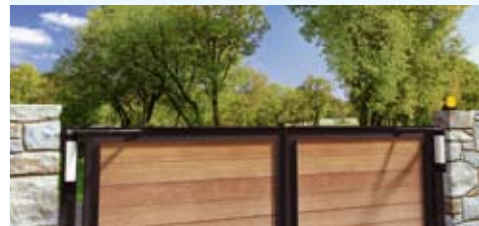
motore esterno adatto a pilastri di piccole dimensioni.

STYLO L'AUTOMAZIONE ESSENZIALE E MODERNA PER CANCELLI CARRAI.